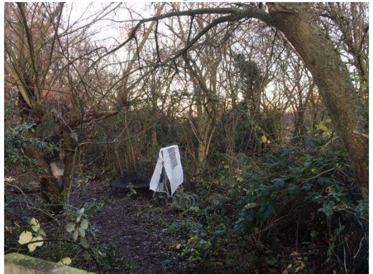
Naturfreundegarten Bergheimer Straße